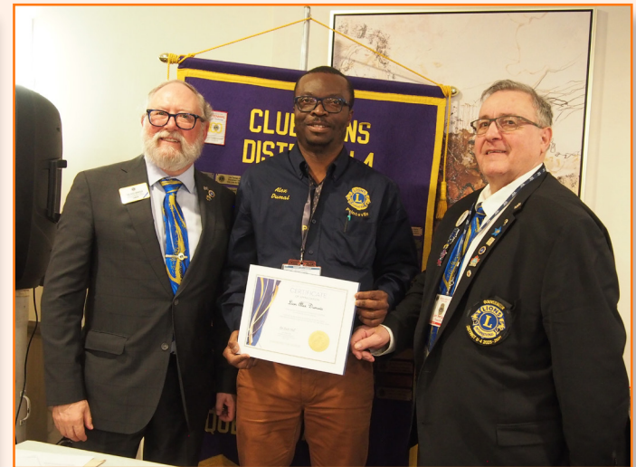
Lion Alex Dumai (Affiche de la paix)